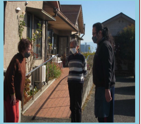
全員真剣に取り組ま した!! 報告